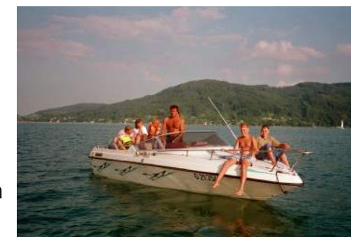
Sommerfeeling pur für die ganze Familie

Wir haben vom 21.- 25. Juli 2019 ein Zimmerkontingent gebucht. Es handelt sich dabei um Zwei-, Drei- und Mehrbettzimmer. Die Woche ist individuell zu planen! Wir übernehmen die Kosten für Nächtigung und Vollpension und bitten Sie um einen Unkostenbeitrag in Höhe von € 100,- pro Erwachsenen, die Kinder sind unsere Gäste. Informationen zum Haus finden Sie unter folgendem Link: http://www.litz-erlebnishaus.at